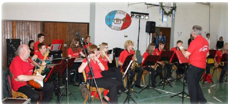
CuO MRW beim Kreismusikfest