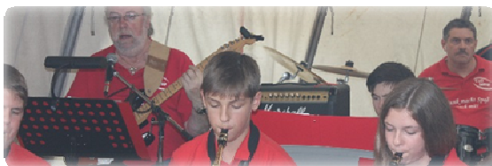
CuO MRW beim Lengeder Apfelfest