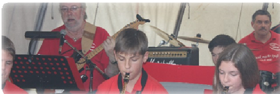
CuO MRW beim Lengeder Apfelfest